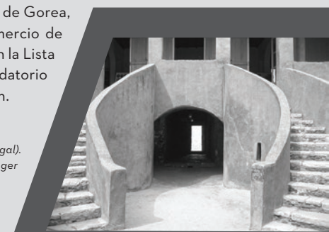
The House of Slaves (Gorée Island, Senegal).

El título “ El Arca del Retorno ” es un contraste deliberado con La Puerta del no Retorno , a través de la que esclavos africanos fueron deportados a las Américas. La Puerta del no Retorno se encuentra localizada en la “Casa de los Esclavos”, un museo de recordación en la isla de Gorea, Senegal. Se considera haya sido el mayor centro de comercio de esclavos en la costa africana. En 1978, esta isla se incluyó en la Lista del Patrimonio Mundial de la UNESCO y sirve como recordatorio de la explotación humana y santuario para la reconciliación.